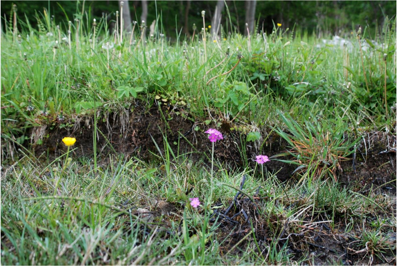
Afsnit b, vestkanten af det afgravede op til kant: 6 blomstrende og 3 vegetative Melet Kodriver, i alt 9