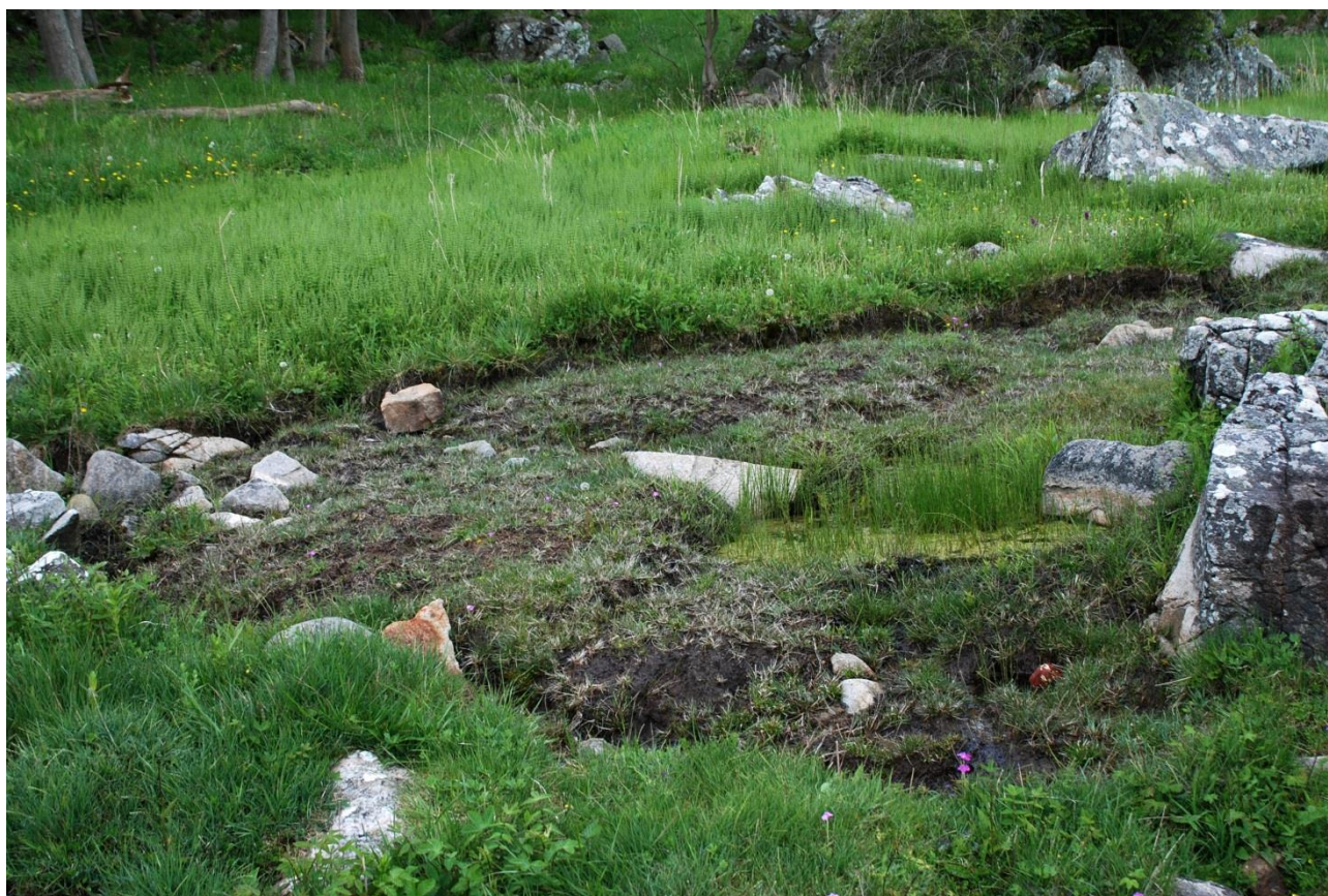
Afsnit a: 10 blomstrende og 14 vegetative Melet Kodriver, i alt 24