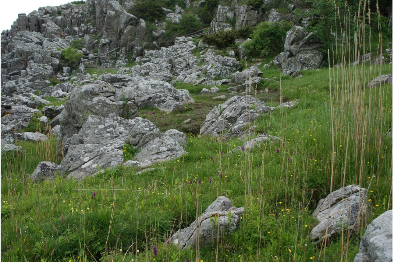
Afgravning fra NV