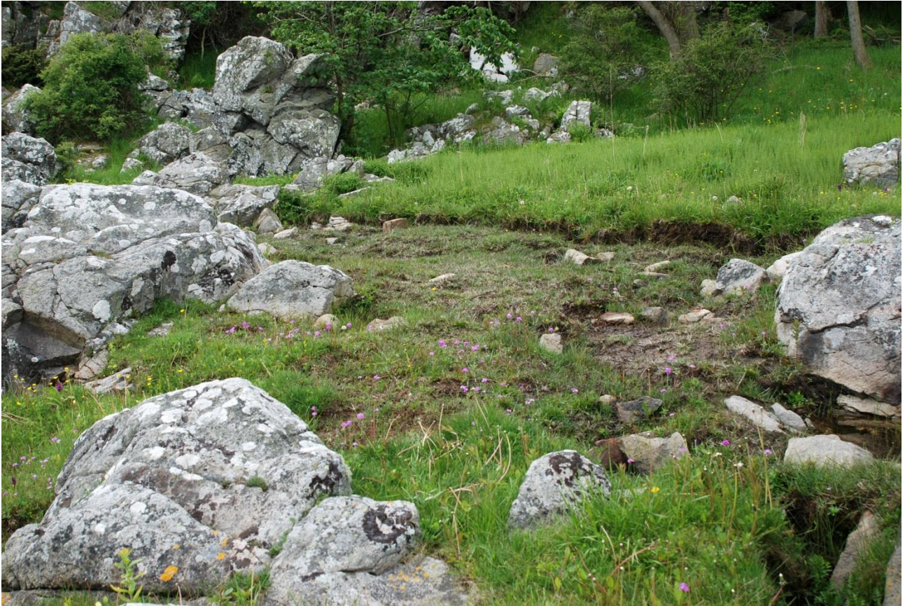
Afsnit d, NØ-hjørnet: 128 blomstrende og >60 vegetative Melet Kodriver, i alt >188

På det afgravede felt blev der talt 154 blomstrende og >80 vegetative Melet Kodriver, i alt >232