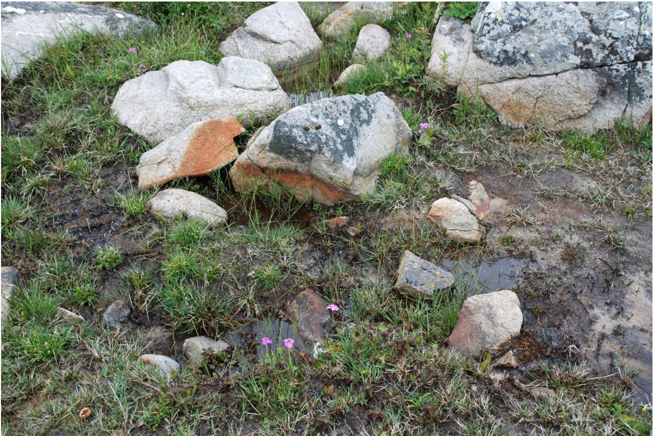
Afsnit c, NV-hjørne med løse sten og klipper: 10 blomstrende og 2 vegetative Melet Kodriver, i alt 12