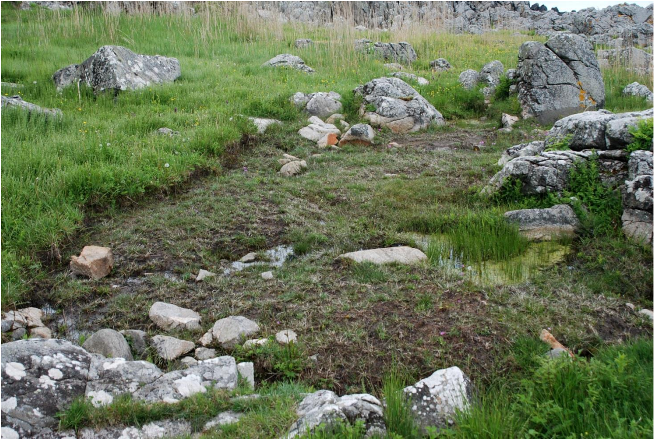
Afgravning fra SØ