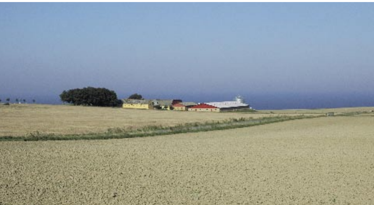
Fig. 1. Fremtidens bornholmske åbne land: Få store gårde omgivet af store marker med meget lidt natur.

genkomst på jorden som en altødelæggende hændelse for klodens levende organismer på niveau højere end encellede bakterier!