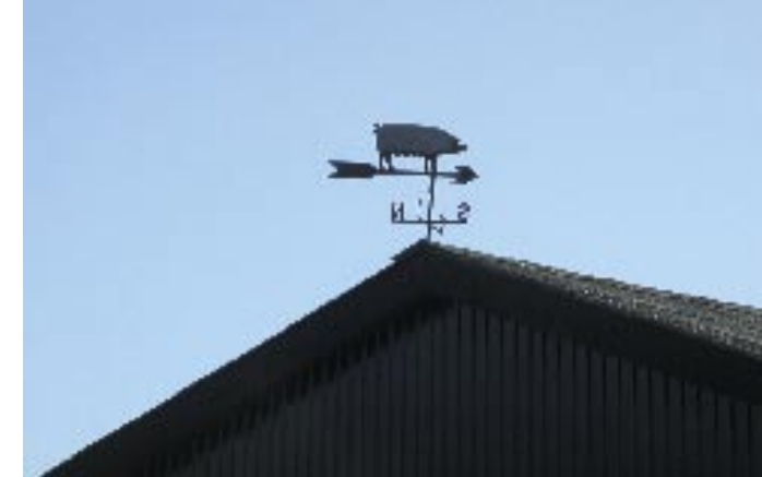
Fig. 7. Vindens retning har betydning for lugtgener omkring gårde med svinebrug.

gen - måske endnu ældre. Diget blev bygget i en tidligere mose, som selvfølgelig for længst er drænet ud og tørlagt, og i 1961 var store dele af diget allerede blevet fjernet.