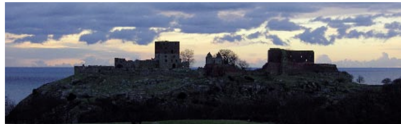
Fig.5. Hammershus, fortsat knejsende alene på sin slotsbanke.

Det lykkedes, og i dag kan vi efterkommere med stor taknemmelighed se tilbage på disse mænds fremsynede tanker og ihærdige indsats. I 2006 kunne den ene af disse foreninger, Foreningen Bornholm, fejre 100 års jubilæum "still going strong".