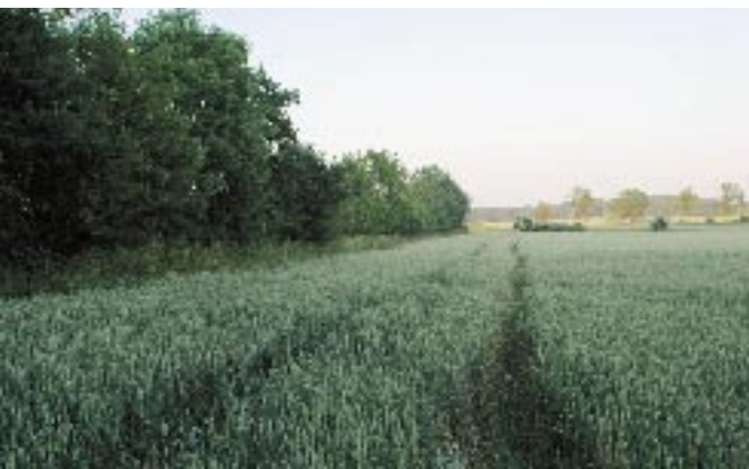
Fig. 6. Sogneskellet mellem Nyker og Vestermarie - før det blev fjernet.

Uanset naturfredningslovens gode hensigter var danskerne særdeles kreative, når det gjaldt om at skaffe sig selv fordele, og der blev hele tiden behov for at stramme op – ene og alene for at skaffe kommende generationer, vore egne børn og børnebørn en chance for at opleve noget af naturens mangfoldighed, der engang var!