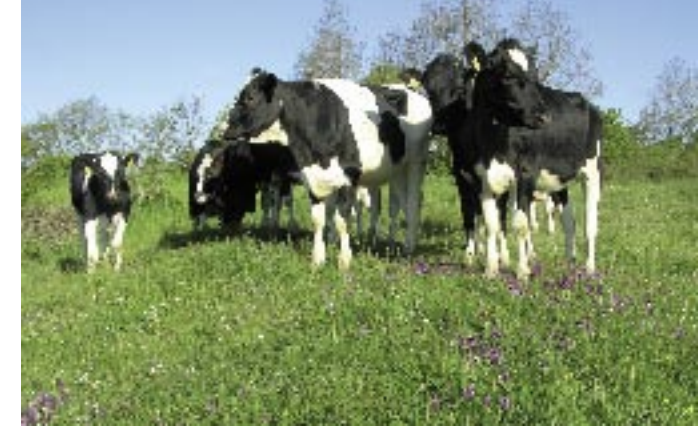
Fig. 8. Kreaturer på græs er forudsætningen for en artsrig flora. Ugleenge.

Det unge par har trods modstanden fra det offentlige sikret en videreførelse af et typisk bornholmsk kulturlandskab med indhold af egnskarakteristiske dyr og planter til kommende generationer. Det er der ikke mange af øens store landmænd med tusindvis af kroner i tilskud fra EU hvert år, der kan hamle op med.