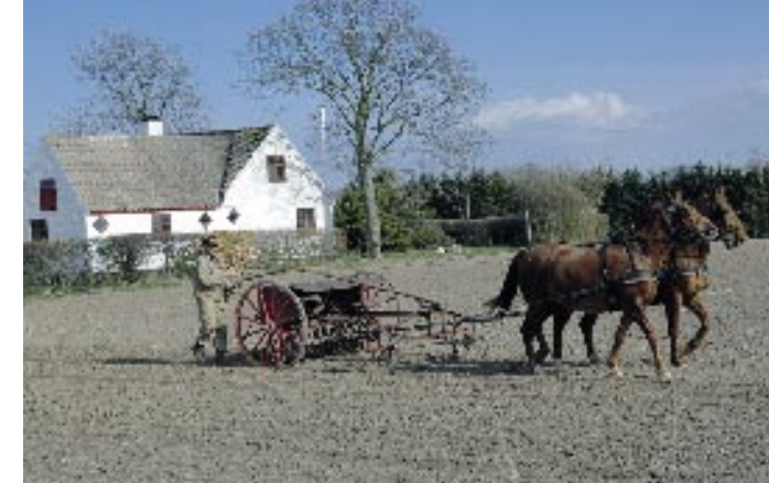
Fig. 2. Fortidens åbne land: mange små landbrug omgivet af mere natur.

Det bornholmske landskab og dermed øens natur har mere eller mindre været under konstant omstrukturering, og det, vi kender til i dag, blev formet af de fysiske kræfter under seneste istid og nåede et maksimum, udtrykt i biodiversitet, for omkring 8.000 år siden, da klimaet var behageligt mildt, og vi mennesker som jægere og samlere boede i små familiegupper jævnt fordelt på øen, høstede af overskuddet og lod naturens kapital være intakt. Vi mennesker var elementer i et økologisk samfund.