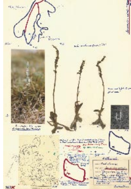
Fig. 10 & 11. Trods fredning blomstrende de sidste skrueaks i Skandinavien i 1981 i en løkke ved Rønne. Belæg med skrueaks i Arne Larsens herbarium.

med deres karakteristiske plantevækst i form af bl.a. orkideer gror derfor til i krat og skov, godt hjulpet på vej af et stort nedfald af ukontrollabel luftbåren gødning. De vokser sig bogstaveligt talt ud af beskyttelsen!