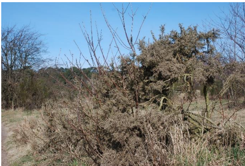
Udgået tornblad efter en vinter med hård frost

Et held for de sjældne planters ve og vel har det været, at nogle lokale pensionister, "Galgeløkkens gæve gutter", under vejledning af kommunens landskabsforvalter har taget en sav og en grensaks i egne hænder og de seneste somre sørget for, at al den "grønne pest", der truer de sjældne planters eksistens, bliver skåret ned og planternes voksepladser frilagt.