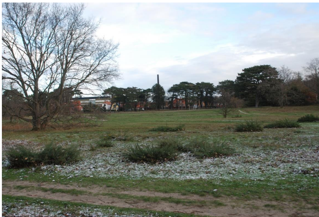
Tornblad i december 2022 – en nytårshilsen med tak til alle de gæve gutter på Galgeløkken