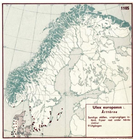
Tornblads forekomst i Skandinavien efter Hultén 1950.

Den er følsom overfor hård frost, og efter nogle kolde vintre kan hovedparten af planterne være helt frosset tilbage.