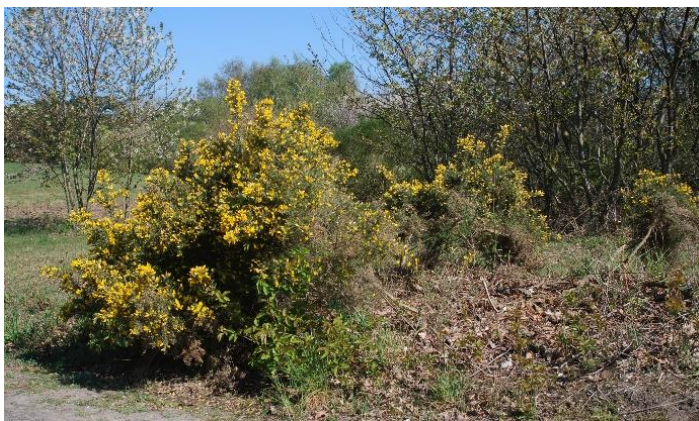
Der er lysnet omkring nogle tornblad-planter

Det er ikke alle hundeluffere, der kan se fornuften i, at der bliver skåret opvækst ned på Galgeløkken, og det har resulteret i flere negative indlæg i den lokale avis.