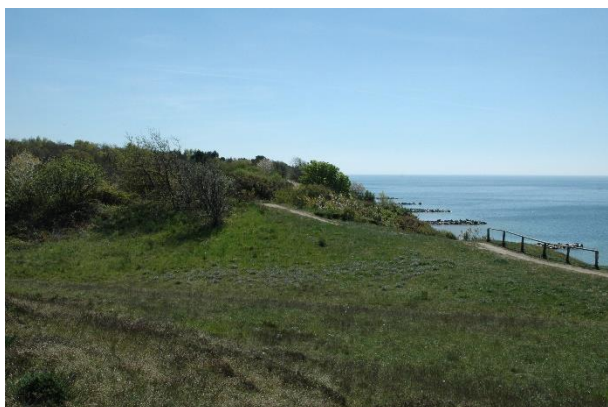
Vokseplads for Opret Kobjælde

Opret Kobjælde har sit eneste bornholmske voksested netop her på den tørre og åbne smeltevandsslette, og da dens eksistens syntes truet, blev den fredet ved en deklARATION i 1924.