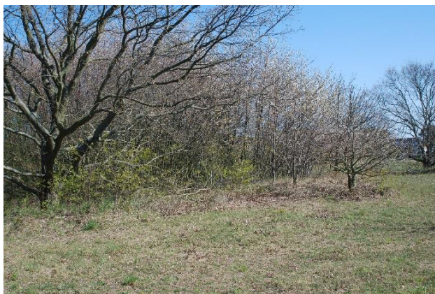
Opvækst af eg og fuglekirsebær skygger tornblad bort.