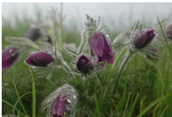
Opret Kobjælde inden de rejser hovederne