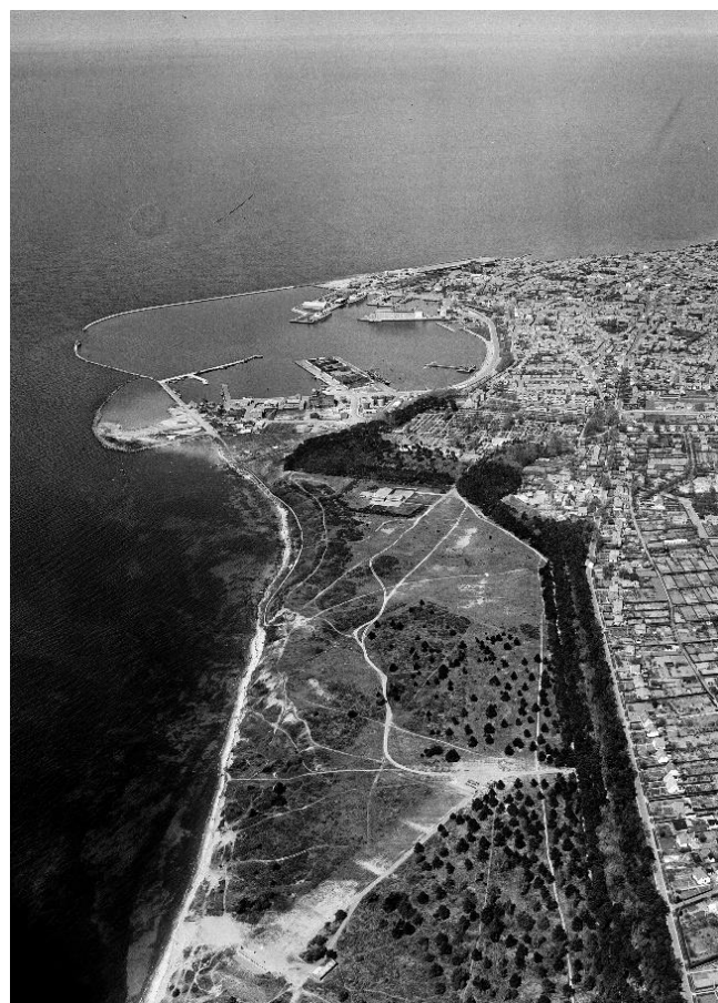
Galgeløkken i 1956 – let bevoksning og skydebane

I midten af 1800-tallet var den desuden excercerplads for Bornholms Væbning.