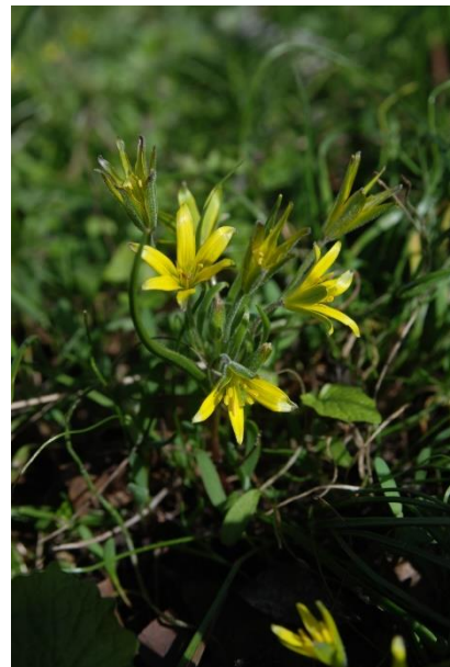
Vokseplads for Ager-Guldstjerne yderst på smeltevandssletteskrænten ved den tidligere Dommerbæk

Endelig er Galgeløkken i botaniske kredse kendt for at være stedet, hvor man kan opleve Tornblad . Det er en ærteblomst, der blomstrer i den tidlige vinter, men ved hård frost fryser planterne tilbage. Også forekomsten af Tornblad er presset af den omsiggribende opvækst af eg, kirsebær og seljepil.