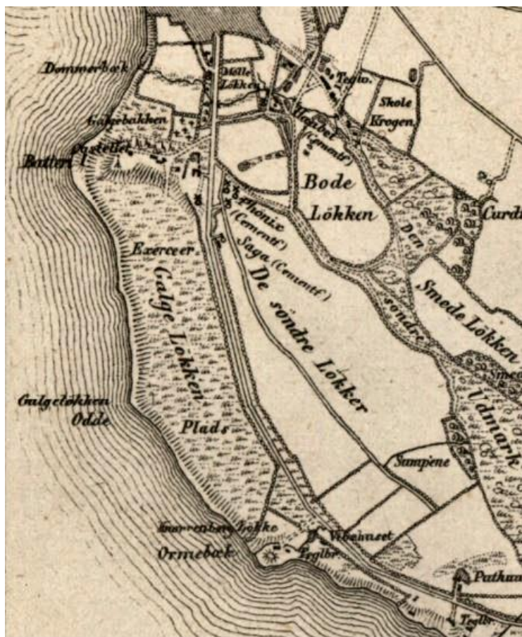
Galge Løkken 1858 som excercer plads

Galgeløkken var i middelalderen afgrænset ind mod land af et stengærde og den blev benyttet som græsningsareal for købstadens dyr, heste og køer.