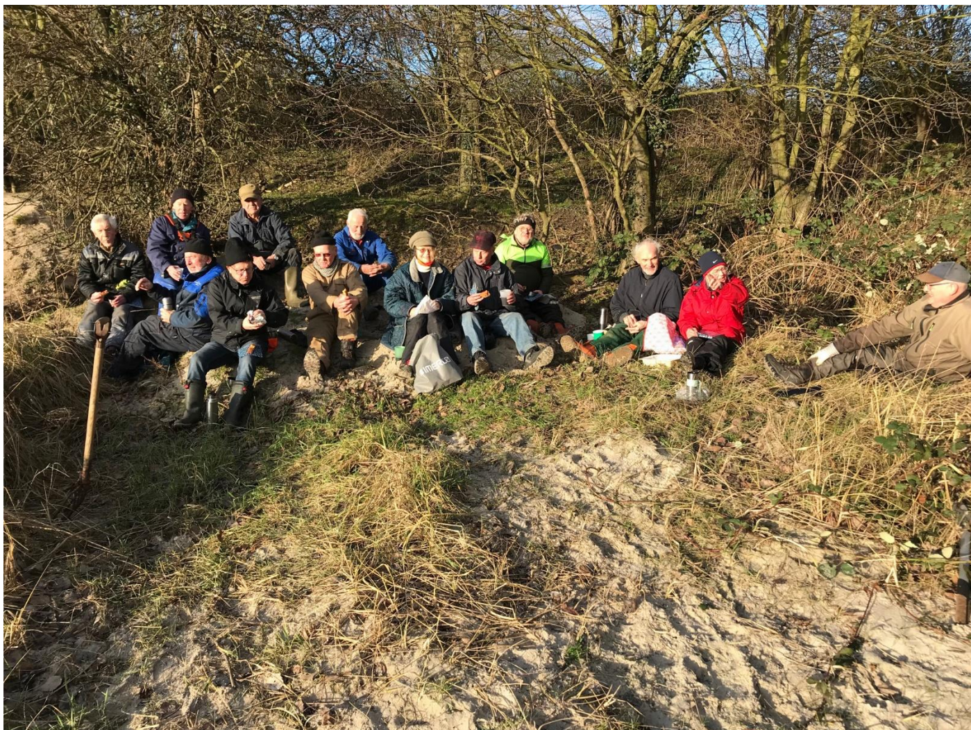
Opstart på sæson 2022 - Gæve gutter og -inder ved den stiftende generalforsamling 25. januar 2022.