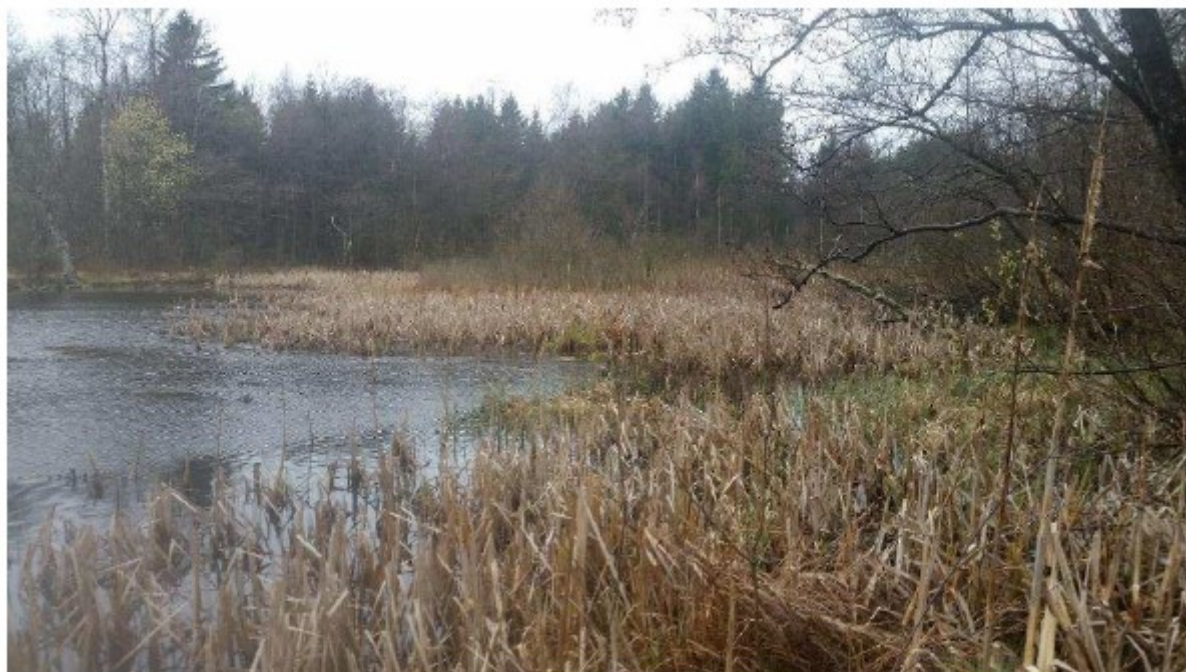
Figur 4 Tilgroning med bredbladet dunhammer i den sydlige del af Iglemosen. Fra ansøgning.