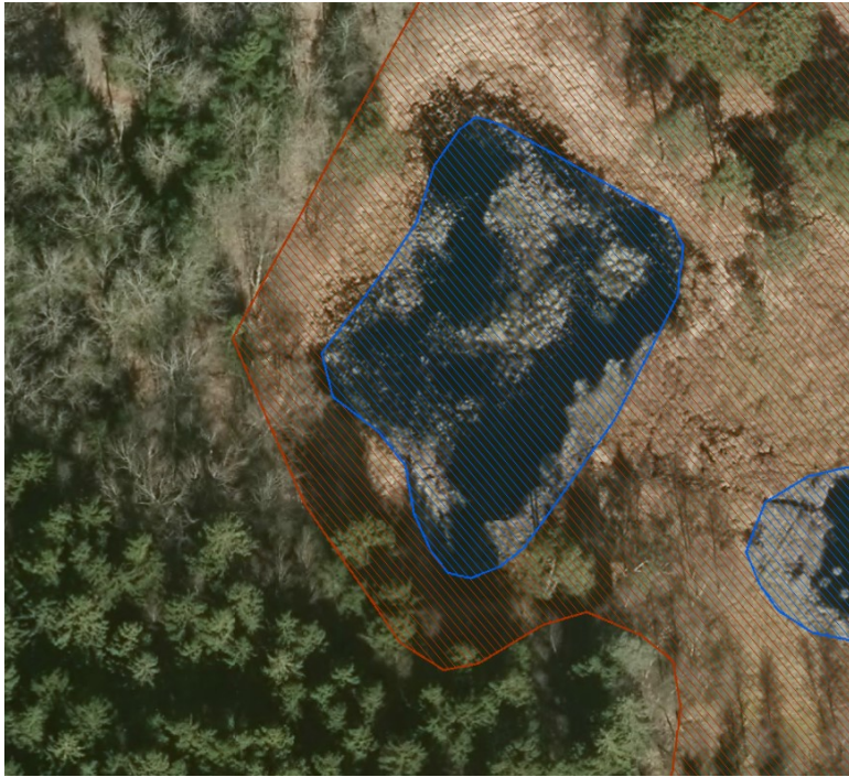
Figur 1 Luftfoto med § 3-beskyttet natur. Den beskyttede sø Baremose ses midt i billedet med blå skravering. Med rød skravering omkring er vist beskyttet mose.