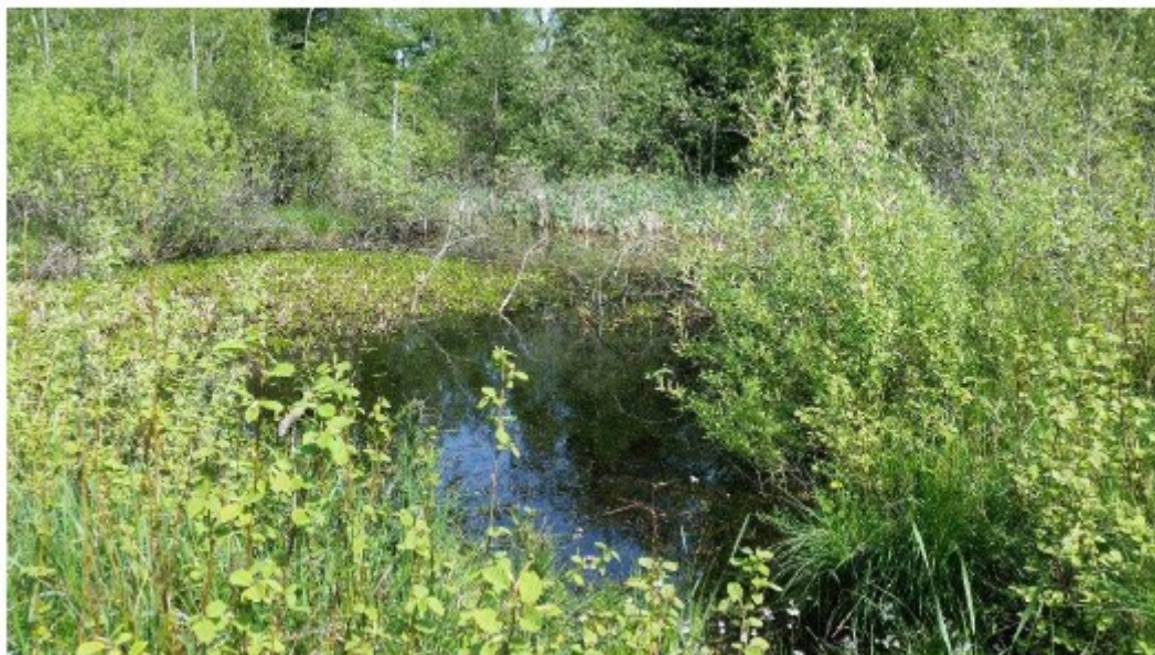
Figur 5 Nordlig sø i Iglemosen. Fra ansøgning.