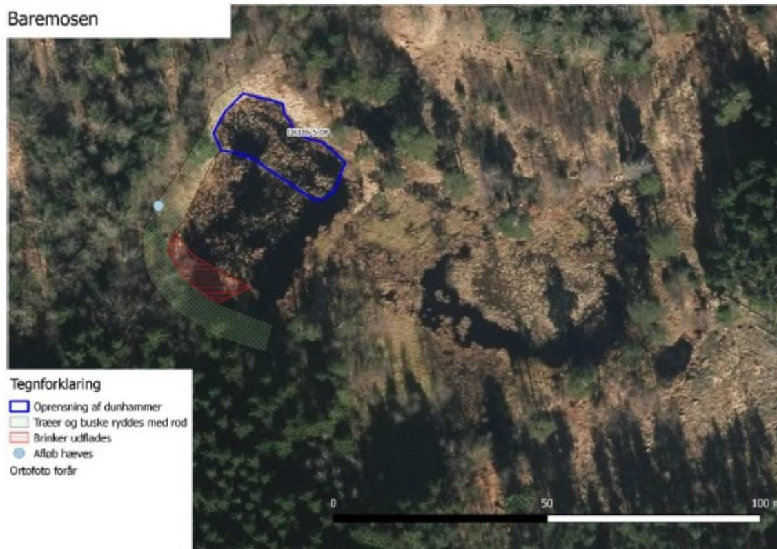
Figur 3 Ansøgte restaureringstiltag vist på luftfoto. Hævning af afløb behandles ikke i denne dispensation. Fra ansøgningsmaterialet.