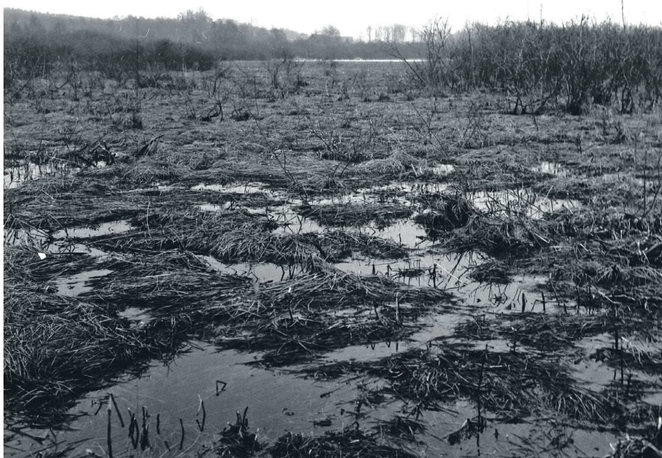
Engang var der vand i moserne, som her i Vallensgårds mose.

Frisk vand har altid været forudsætningen for dyr og menneskers liv og bosætning. Det har vist sig mange steder ved oldtidens bebyggelser, at man ikke nøjedes med at tage vand fra en å eller en sø – det kunne jo være forurenset – det skal være fra en frisk kilde. Og hvor mennesker færdes er der chancer for at finde nogle af de ting, de har tabt, glemt eller kasseret og smidt ud. Derfor er der gode chancer for at finde oldsager og andre levn ved kilderne. Sådan også her. For nogle år siden fandt arkæologerne fra Bornholms Museum blandt andet et velbevaret træskaft til en slags le fra stenalderen i de øverste jordlag i kilden. Så der var store forventninger til at finde mere – redskaber, keramik eller personlige ting – da et hold studerende fra Konservatorskolen i København i forsommeren gik i gang med at grave kilden ud. Det blev ikke til så mange fund, men man fandt enden af syv tilspidsede pæle, stukket dybt ned i kilden, som en kant om en træbrønd, samt to parallelle rækker mindre pæle på begge sider af kilden, som funderingen til en gangbro for folk, der skulle hente vand i kilden i oldtiden, eller dyr, der skulle drikke af vandet. Stolperne er ikke aldersbestemt endnu, men deres placering under jordlaget med le-skaftet kunne tyde på, at brønden er lige så gammel som hustomterne med mikrolitterne: Fra Maglemosetiden, ca. 8000-7000 f.Kr. Og nu skal man altså prøve at finde ud af om brønden rummer flere fund.