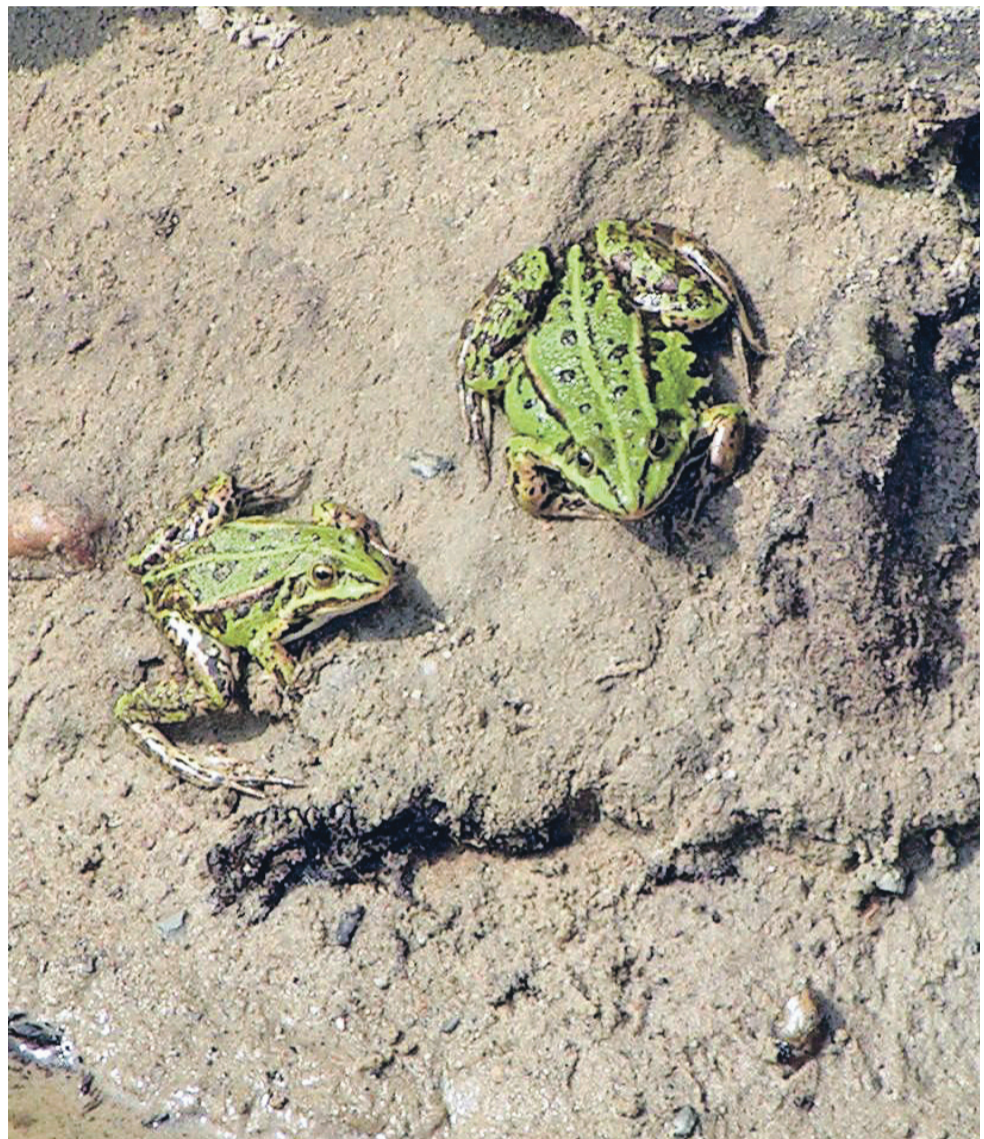
Grønne frøer i solen ved vandhullet.