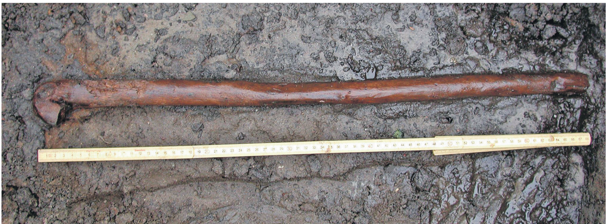
Skaftet til en flint-le fundet i brønden ved Hullegård.