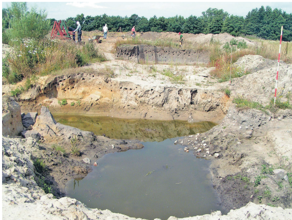
Ved Hullegård i Povlsker er en stenalderboplads ved at blive gravet ud bag ved den gamle brønd, som der stadig er vand i.