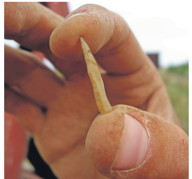
Flintspids-mikrolit fra stenalderen