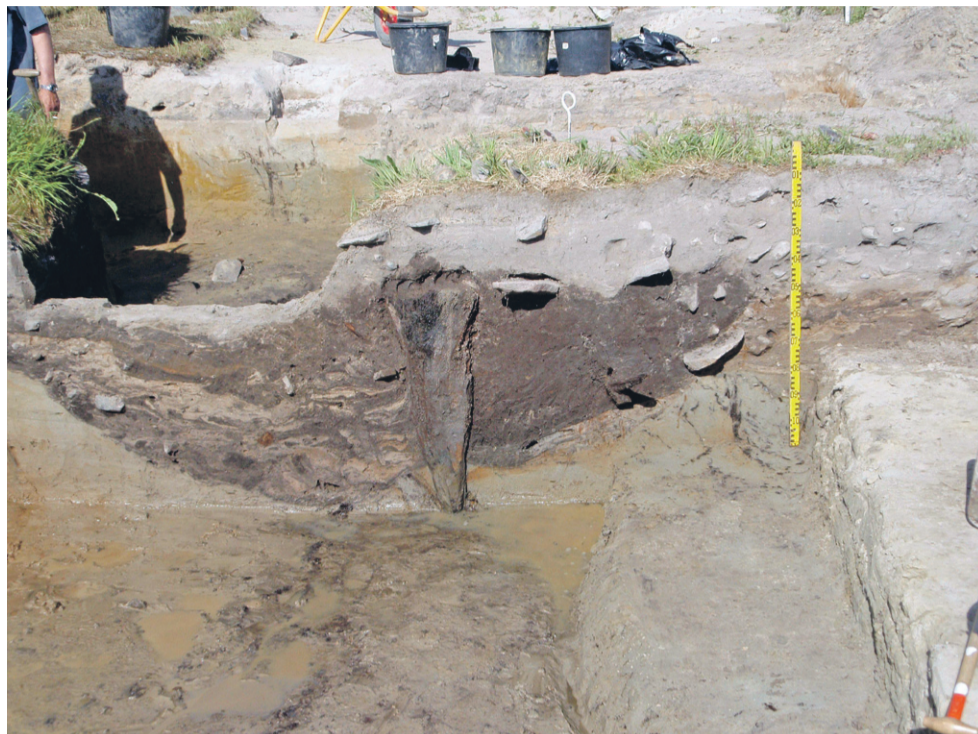
En af stolperne i stenalderbrønden under udgravning