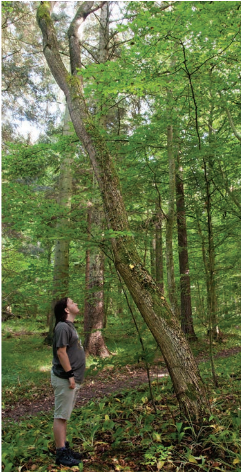
Figur 4. Tarmvridrøn i skoven i Døndalen. Stammediameter i brysthøjde (1,30 m over jorden) = 36 cm, kævlens længde (op til tvegen) = 6,5 m, træets højde = ca. 16 m. Tyske undersøgelser har vist, at det aldrig er for sent at hugge for en tarmvridrøn. Selv gamle træer reagerer på hugst, men en skæv stamme retter sig selvfølgelig ikke. I dette tilfælde har træet søgt efter lys ud mod skovstien, fordi det gennem lang tid er blevet forsømt med hugst. Foto: 8. juli 2012.

afkom af 'gode' træer i Ulvshale Skov på Møn eller fra et af artens optimumområder i Tyskland eller Frankrig.