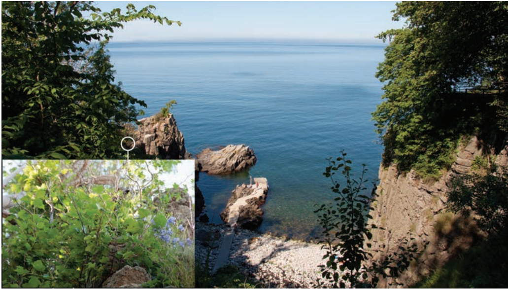
Figur 9. Røn på Libertsklippen vest for Gudhjem. Man skal have øjnene godt med sig for at identificere de enkelte arter. Markeringen med det indsatte billede viser en tarmvridrøn. Lige nord for træet (eller træerne?) står der en lidt større klipperøn og mod vest en endnu større almindelig røn. På Capri-klippen overfor (til højre i billedet) er der nogle store seljerøn. Seljerøn formodes oprindeligt at være opstået som en krydsning mellem de tre øvrige arter. Måske foregår der stadig hybridisering og lokal artsdannelse inden for slægten Sorbus på Bornholm. Foto: 8. juli 2012.

bar biologisk forbindelse i form af sammenhængende naturområder, økologiske ledelinjer eller dyr. Hertil kommer, at kendskabet til den enkelte arts økologi er begrænset.