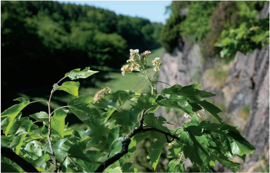
Figur 3. Blomstrende tarmvridrøn i Ekkodalen. Foto: Finn Hansen, 1. juni 2008.

efterstræbes stærkt af græssende husdyr, hårvildt og mus. Pleje i form af græsning er derfor uhensigtsmæssig.