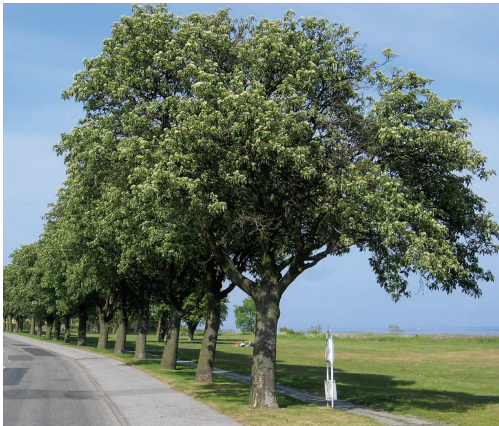
Figur 6. Seljerøn som vejtræ langs Stenbrudsvej ved østkysten nord for Nexø. Foto: Flemming Rune, 30. maj 2004.

Med en passende opkvistning og tynningshugst vil man uden tvivl kunne producere kvalitetstræ på stammer af kævle-