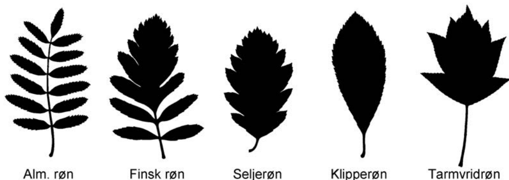
Figur 1. Bladsilhuetter af de fem rønnearter på Bornholm.

Røn er generelt lystrearter og trives derfor bedst i det åbne land, skovkanter og lysåbne skovtyper. De er samtidig, hvad man kan kalde klimarobuste, og tåler tørke, frost og andre klimaekstremer. Røn har en række pioneregenskaber, men