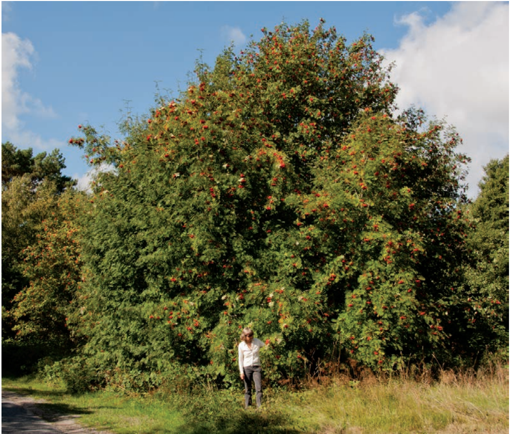
Figur 8. Almindelig røn bidrager markant til landskabets æstetiske kvaliteter, her med flot røde frugter. Foto: 15. august 2013.

På Bornholm findes almindelig røn, finsk røn, seljerøn, klipperøn og tarmvridrøn nogle steder i samme område og inden for kort afstand. Det gælder for eksempel på Helligdomsklipperne vest for Gudhjem (figur 9). Her er artsdannelsen inden for slægten Sorbus formodentlig fortsat aktiv. Fremmede rønarter, som er plantet eller forvildet, bidrager naturligvis også til denne proces.