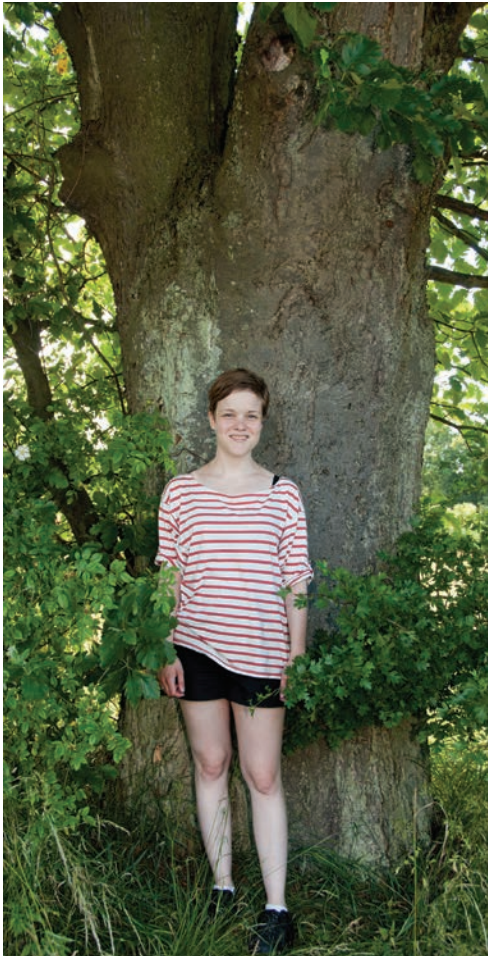
Figur 7. Seljerøn i læhegn nord for Bornholms Kunstmuseum på vej ned til Helligdomsklipperne. Træet er formodentlig omkring 100 år, og stammen har en diameter i brysthøjde på 90 cm. Foto: 8. juli 2012.

dimension i løbet af en rimelig årrække. Seljerøn burde derfor afprøves som skovtræ.