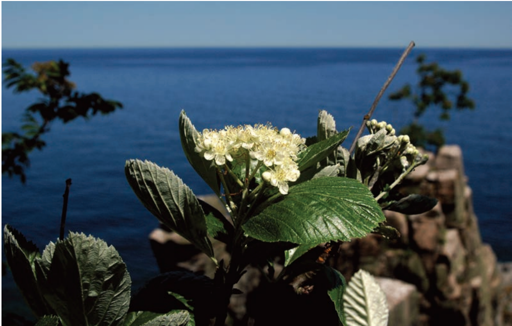
Figur 5. Blomstrende klipperøn på Libertsklippen ved Helligdommen på Bornholms nordkyst. De opretstående blade og bulen i bladets midte er typisk for klipperøn. Bulen skyldes, at bladranden holder op med at vokse tidligere end bladets indre dele. Foto: Finn Hansen, 9. juni 2007.

Klipperøn findes nogle få steder som indblanding i lysåbne skovtyper, blandt andet i Norge og England. På Bornholm er den udelukkende en udkantsart på skrænter og klippepartier, som er uinteressante til vedproduktion (figur 5).