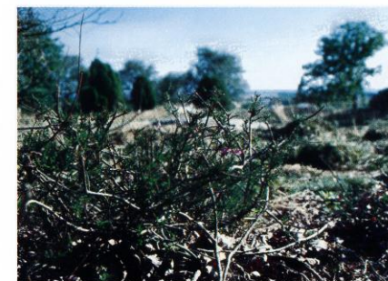
Hedelyng på Klintebakken

Landskabsplejen på Klintebakken søger at fremme vilkårene for den tilbageværende hedelyng.