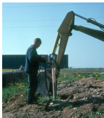
Bavnet 12. maj 2002