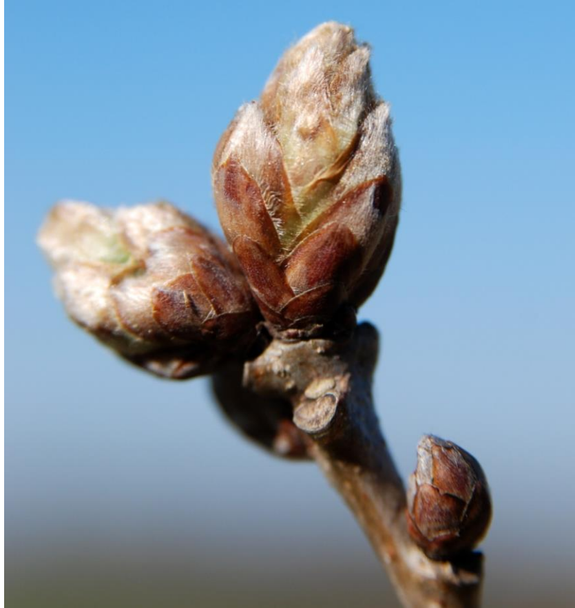
Grundlovs-ege og andre særlige minde-egetræer i Aakirkeby