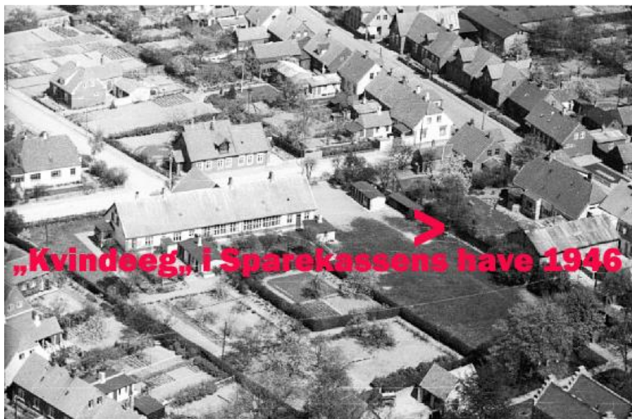
Luftfoto af sparekassehaven, fotograferet af Sylvest Jensen 1946, Statens arkiver.