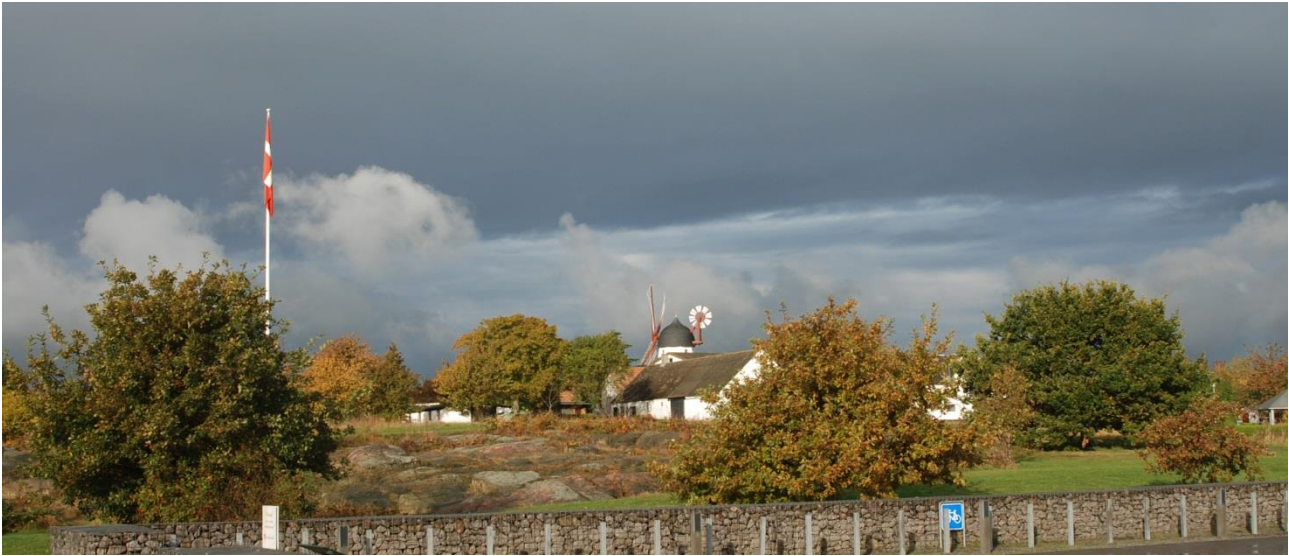
Tre mindeeege for foden af de blotlagte klipper på Bavnet 21. oktober 2015