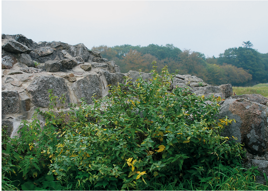
Fig. 4. Svalerod ved indgangen til Lilleborg.

ber, på samme sted, og det var sikkert samme individ!