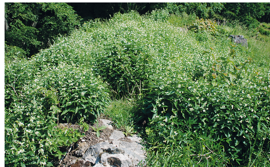
Fig. 3. Svalerod på muren af Gamleborg.

Men, den 17. juni 2019 lykkedes det at få øje på bare én Soldatertæge i bevoxsningen øverst på Gamleborgs nordlige mur. Det gentog sig den 18. septem-