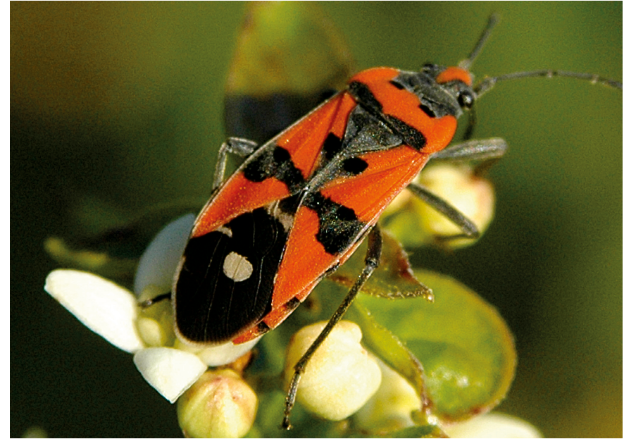
Fig. 6. Soldatertæge på svalerodsblomst.