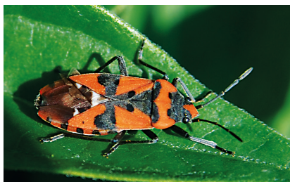
Fig. 5. Første indlandsfund af soldatertæge.

skende resultat, at der inde i borgen blev fundet en voksen Soldatertæge medens der udenfor muren mod syd blev noteret to! Derudover blev der fundet nogle ikke helt udvoksede Soldatertægenymfer.