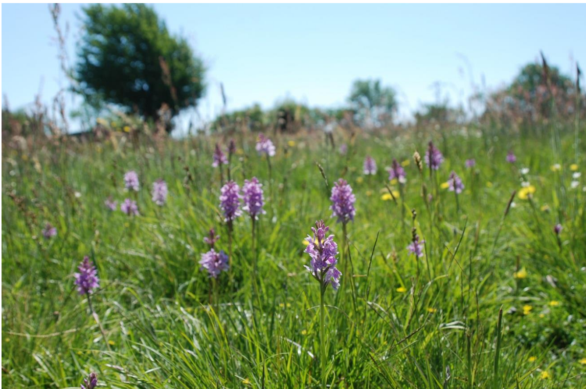
– Plettet Gøgeurt i NV-lige del af Løkken udenfor det gødede areal

og at "Fredningen skal ikke være til hinder for, at der i området foretages landskabspleje for at skabe optimale livsbetingelser for flora og fauna. En sådan foranlediges af fredningsmyndighederne efter samråd med ejeren og uden udgift for denne" .