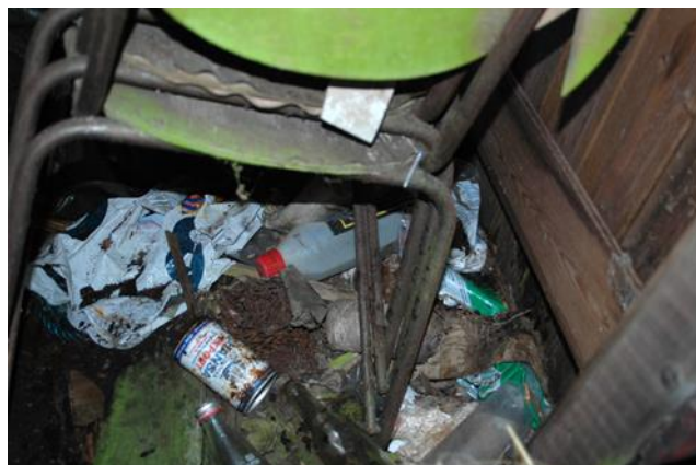
Skurvognen som begyndende ruin november 2007