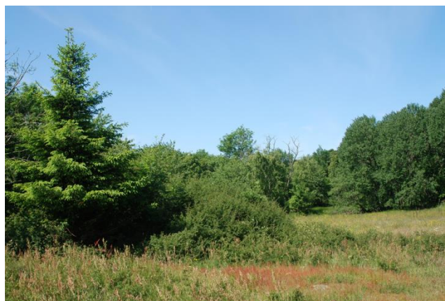
Rødgran midt i løkken juni 2009 og juni 2017

Og så er der skurvognen, som i dag ligger som ruin omgivet af slåen, rose og enebær!