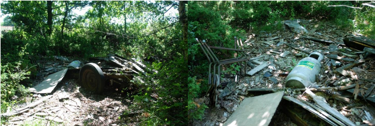
Skurvognen i juni 2017